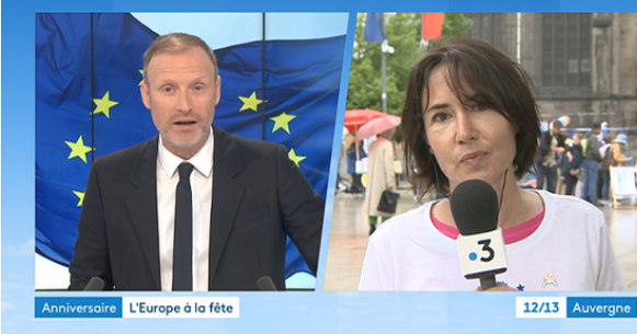
Le Joli Mois de l'Europe - Intranet de la ville de Clermont-Ferrand

Pratique. Ouvert jusqu'au 26 mai, de 9 heures à 12 heures et de 14 heures à 18 heures. Fermé du 18 au 21 mai. Pour les écoles, contacter le Centre Europe Direct. Contact : europedirectclermont63.fr ou 07.65.21.78.55.