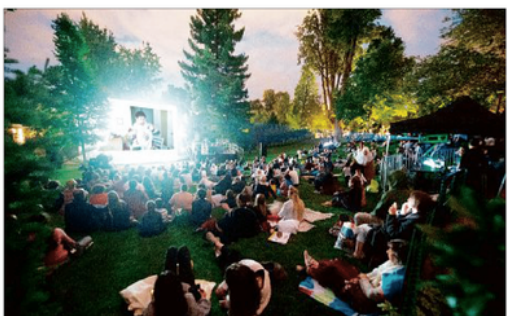
NUIT DE L'IMAGE. Si le beau temps est là, rendez-vous demain samedi au jardin Lecoq.

De Riom à Lescop, du centre-ville de Clermont au quartier des Vergnes, le Joli mois de l'Europe, manifestation européenne, se décline sous plusieurs formes et s'étend sur le territoire du Puy-de-Dôme. Wenique Lacoste-Mettry wenique.lacoste-mettry@clermont.fr Ils étaient environ 2.500, l'an dernier, au jardin Lecoq, pour la « Nuit de l'image européenne ». Malgré les risques d'orage, la manifestation, qui comporte toutes sortes d'animations (1) et se termine à minuit, après un concert (des Cruz Castillo from Durrol), un pique-nique (avec les Grandes tables) et la projection de courts métrages de jeunes réalisateurs européens devait être maintenue, demain samedi.